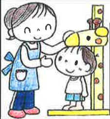
9月の身体測定平均

当園は、保護者や地域住民からの育児相談、子育て支援活動等に積極的に取り組んでいます。(ご相談は電話で日時を確認下さい)